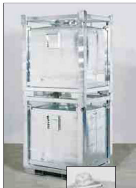
Alle ASF-Behälter sind stapelfähig, so dass eine kompakte, Platz sparende Lagerung möglich ist.