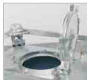
Oberboden mit Mannloch NW 400 und abschließbarem Deckel