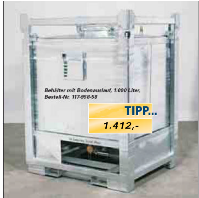
Behälter mit Bodenauslauf, 1.000 Liter, Bestell-Nr. 117-958-58