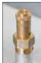
Detailabbildung: Entlüftungsventil zur automatischen Druckentlastung (bei allen ASF serienmäßig im Lieferumfang enthalten)