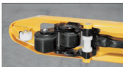
Detailabbildung: strapazierfähige Tandemlaufrollen aus Nylon

hochwertige Lenkräder mit Vollgummibereifung