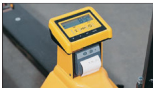
Detail: Waage und Thermodrucker

Typ HWD mit integriertem Thermodrucker. Einsetzbar in einem Temperaturbereich von 0° C bis + 50° C.