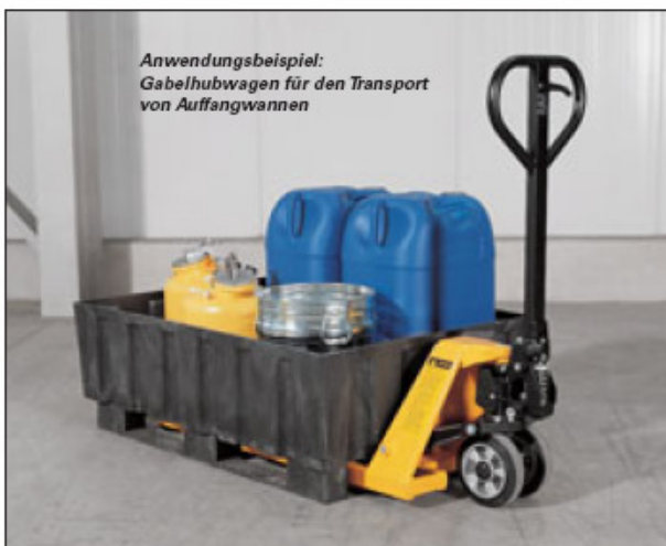
Anwendungsbeispiel: Gabelhubwagen für den Transport von Auffangwannen