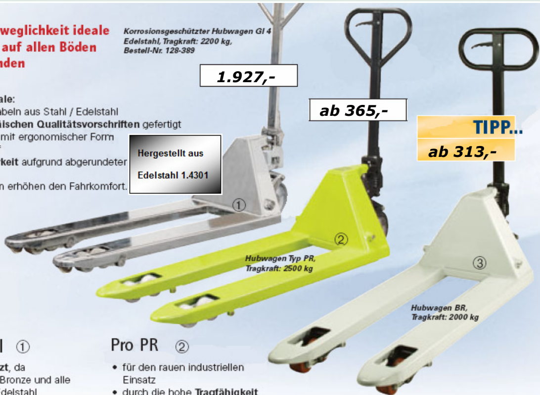
Hubwagen Typ PR, Tragkraft: 2500 kg