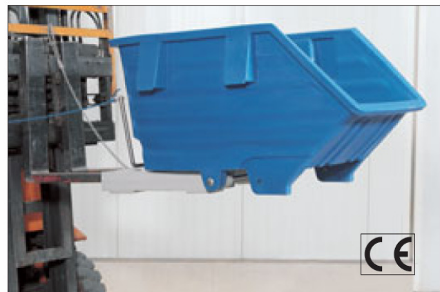
Kippbehälter mit Unter- und Einfahrgestell für Gabelstapler