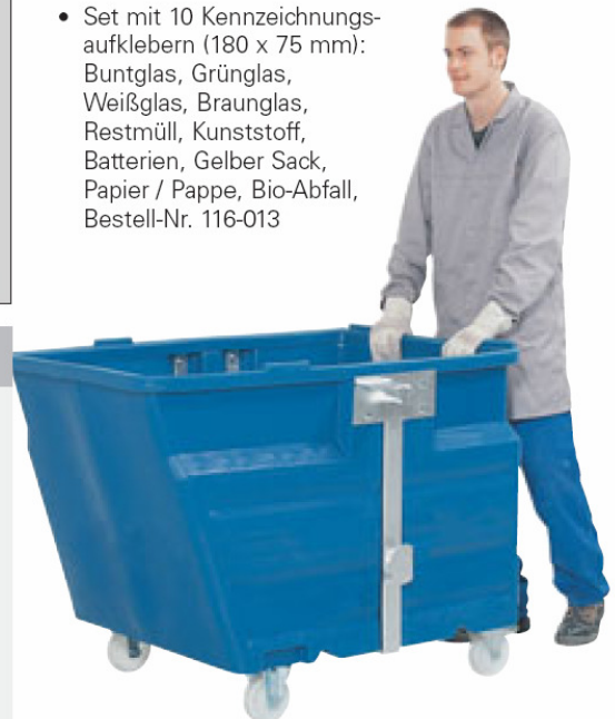
Anwendungsbeispiel: Ausführung mit Rollen