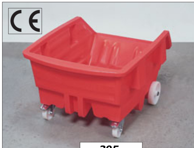
Kippwagen, rot, 300 Liter, Bestell-Nr. 153-535