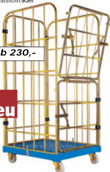
Logistik-Box CL 4, geschlossen mit abklappbarer Tür