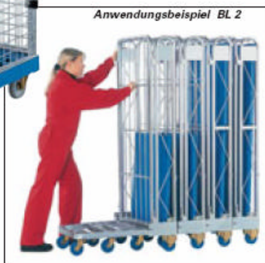
Anwendungsbeispiel BL 2