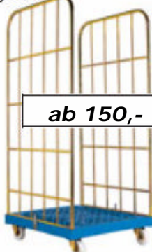
Logistik-Box CL 2, 2-seitig offen