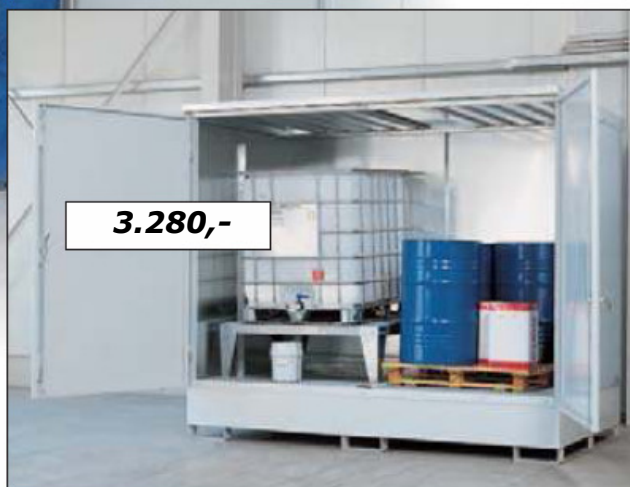
Depot Typ MC 2.10, mit einem Abfüllbock, Bestell-Nr. 137-852, (zerlegte Anlieferung)

Bestell-Nr. 136-432 (zerlegte Anlieferung)