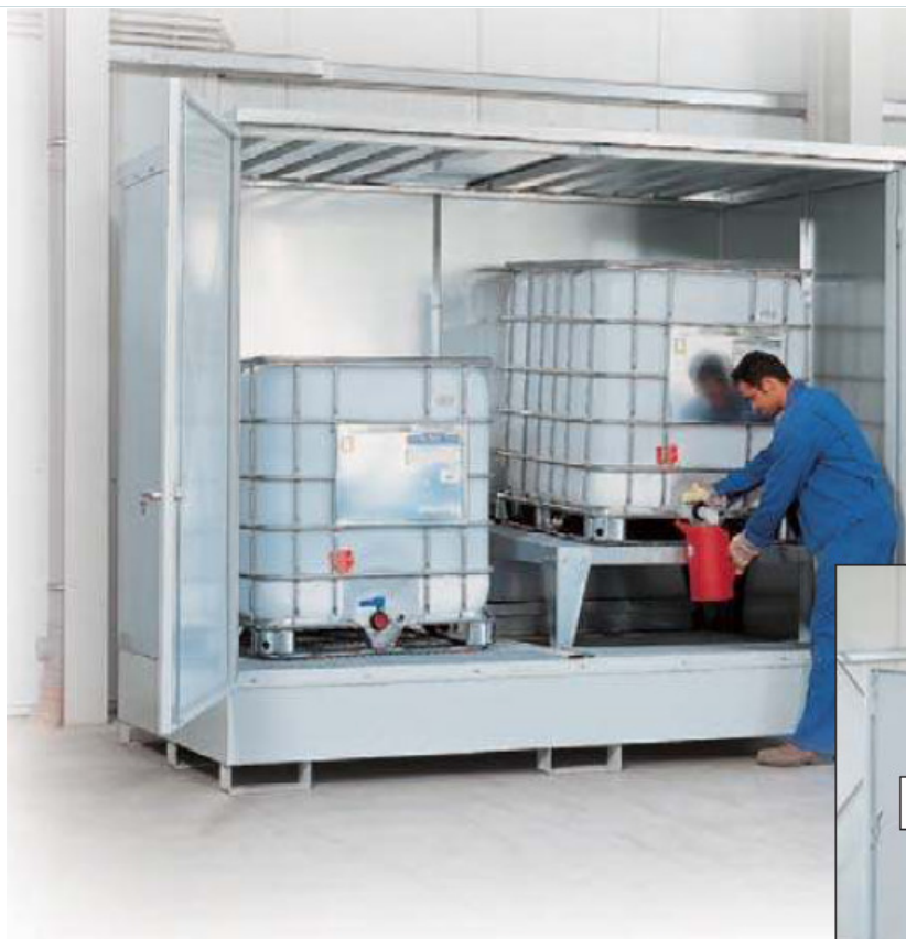
Depot Typ MC 2.10 zum Lagern von bis zu 2 KTCs / IBCs, Abfüllböcke sind optional lieferbar