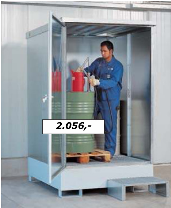
Depot Typ MC 1.6, Bestell-Nr. 136-429, (zerlegte Anlieferung) 600 Liter Auffangvolumen - ideal für Abfüllvorgänge geeignet, 1-stufiger Tritt als Zubehör lieferbar