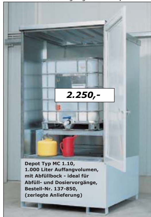
Depot Typ MC 1.10, 1.000 Liter Auffangvolumen, mit Abfüllbock - ideal für Abfüll- und Dosiervorgänge, Bestell-Nr. 137-850, (zerlegte Anlieferung)