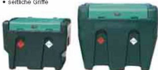
Mobile Dieseltankstellen mit 430 bzw. 900 Litern