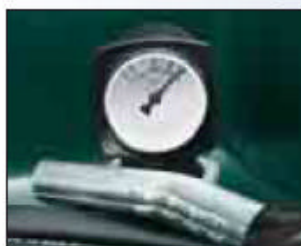
Praktische Kraftstoffstandanzeige serienmäßig