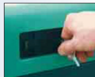
Sicherheitsschloss als Standardausrüstung