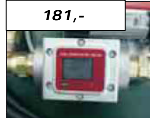
Digitale Durchflussmesser (zulässige Toleranz +/- 0,5%), Bestell-Nr. 172-586-58