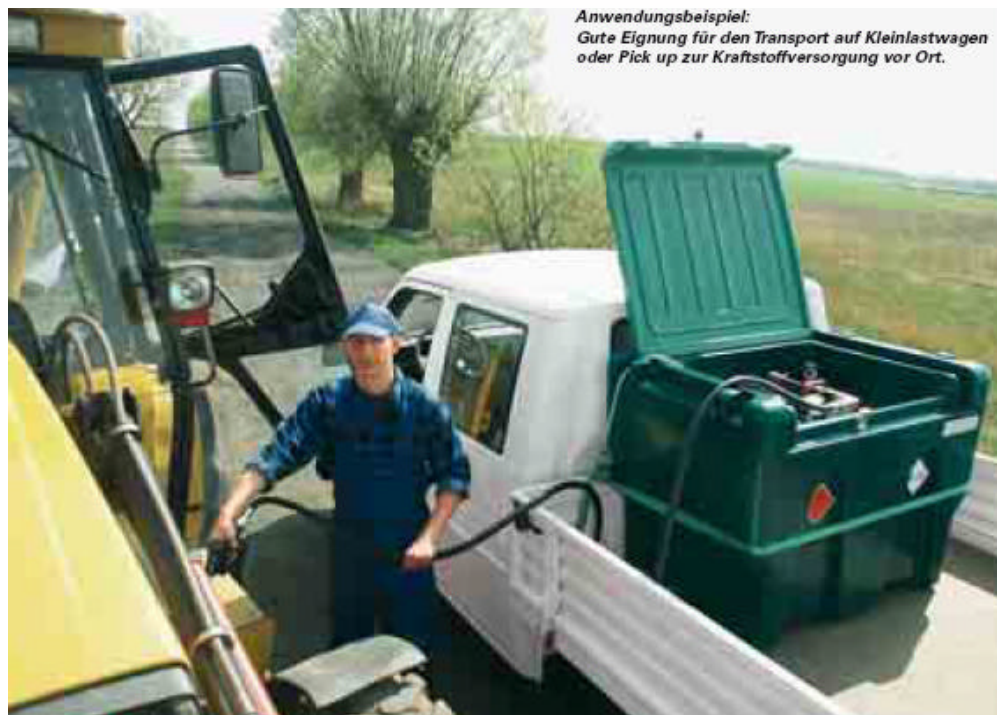
Anwendungsbeispiel: Gute Eignung für den Transport auf Kleinlastwagen oder Pick up zur Kraftstoffversorgung vor Ort.