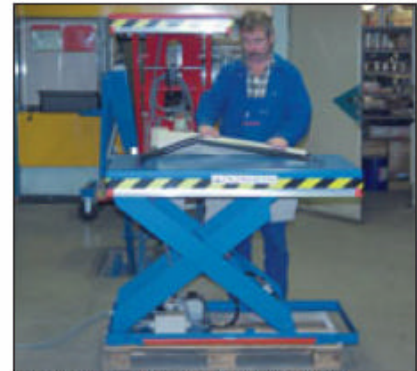
Einsatz eines Hubtisches in der Werkstatt