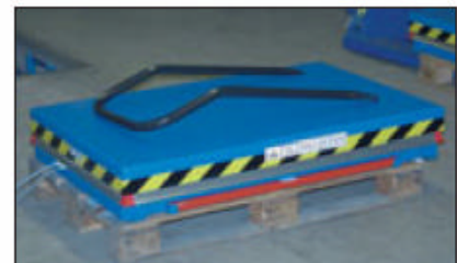
Montagehubtisch in eingefahrenem Zustand