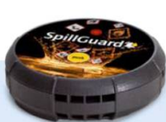
SpillGuard® Bestell-Nr. 271-433-JY