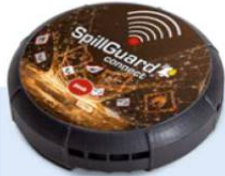
SpillGuard® connect Bestell-Nr. 276-016-JY