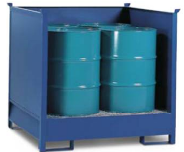
Gefahrstoffdepot 4 P2-O-V50, für 4 Fässer à 200 Liter