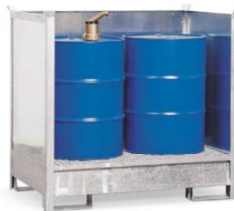
Gefahrstoffdepot 2 P2-O, verzinkt, für 2 Fässer à 200 Liter