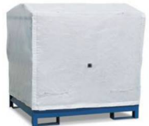
Abdeckhaube für 2 P2-O / -R