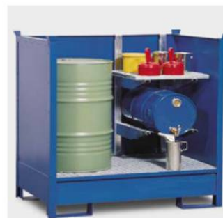
Gefahrstoffdepot 2 P2-O, lackiert, mit Regal für Kleingebinde