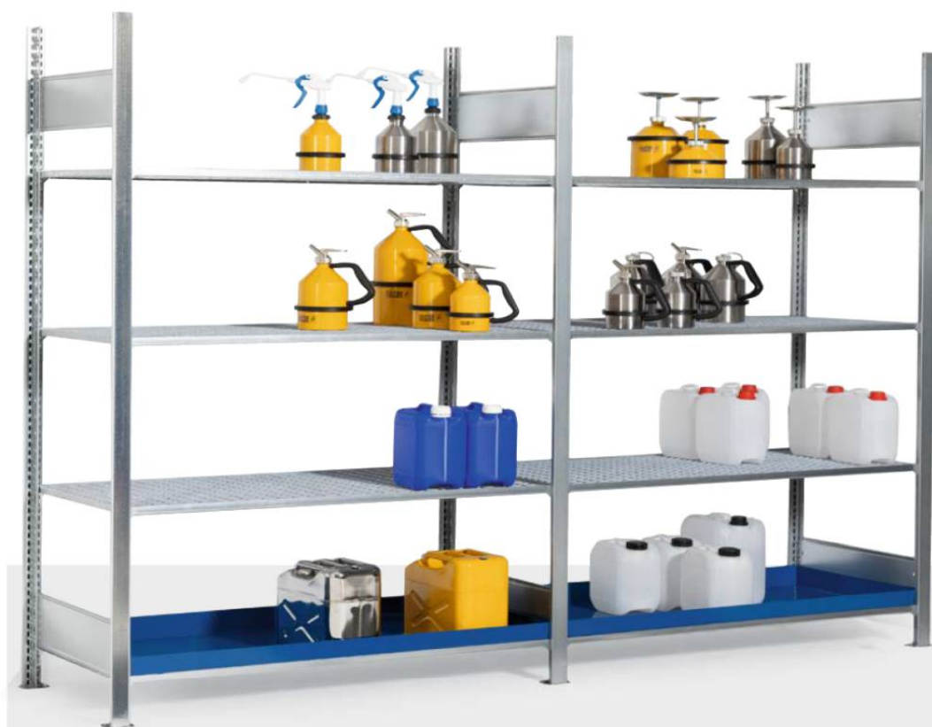
Gefahrstoffregal Typ GRG 1360, bestehend aus Grund- und Anbaufeld

i Alle Regale verzinkt für optimalen Korrosionsschutz