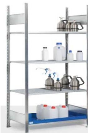
Gefahrstoffregal Typ GRG 1060 Bestell-Nr. 199-560-JY