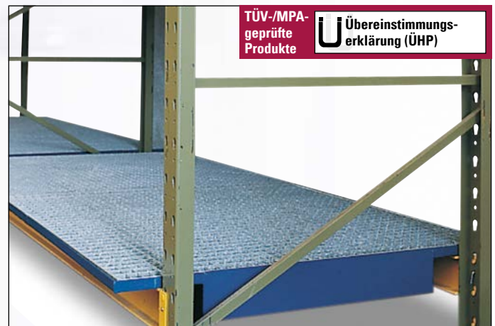
Regalwanne Typ SRW aus Stahl

i Vorhandene Regale für wassergefährdende Stoffe müssen gemäß WHG mit Auffangwannen nachgerüstet werden. Nennen Sie uns die Maße A bis C Ihres Regales und wir helfen Ihnen gern bei der Auswahl der optimalen Wannengröße.