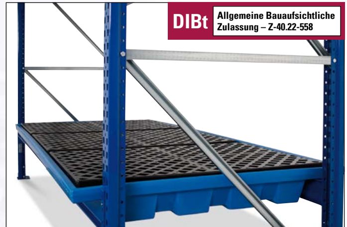
Regalwanne KRW aus Kunststoff