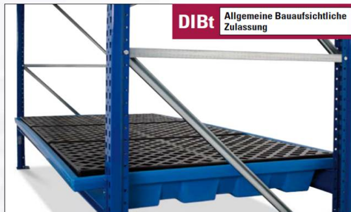
Regalwanne KRW aus Kunststoff