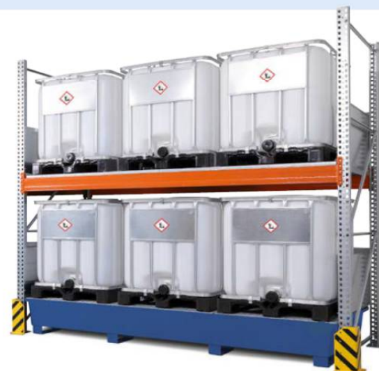
Combi-Regal Typ 3 K6-I, Grundfeld (Einleitbleche und Anfahrtschutzdecken optional), Bestell-Nr. 199-729-JY

i Für die Lagerung von Säuren und Laugen empfiehlt sich ein Auffangwanneneinsatz aus Kunststoff, siehe Tabelle "Zubehör".