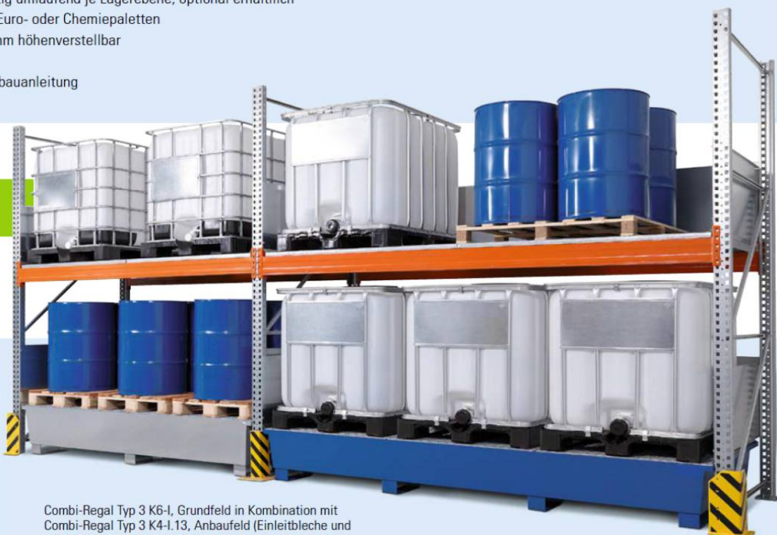
Combi-Regal Typ 3 K6-I, Grundfeld in Kombination mit Combi-Regal Typ 3 K4-I.13, Anbaufeld (Einleitbleche und Anfahrtschutzdecken optional)

i Alle Regale verzinkt für optimalen Korrosionsschutz