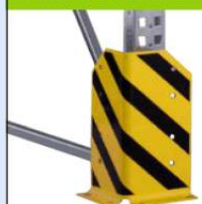
Anfahrtschutzcke Bestell-Nr. 203-606-JY