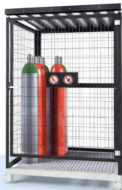
Gasflaschenlager Typ GSN 1.15, mit Bodengruppe