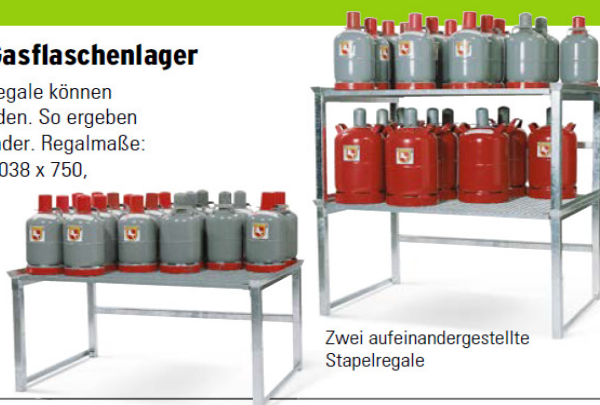
Zwei aufeinandergestellte Stapelregale