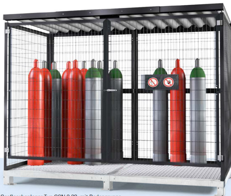
Gasflaschenlager Typ GSN 2.28, mit Bodengruppe