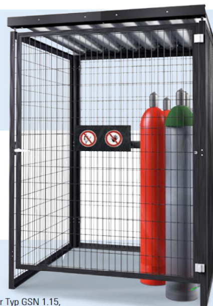
Gasflaschenlager Typ GSN 1.15, ohne Bodengruppe

Die Außenwände von Lagerräumen müssen mindestens feuerhemmend sein.